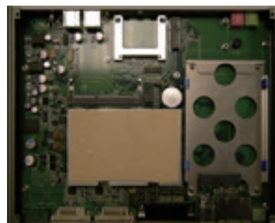
» Fanless Design