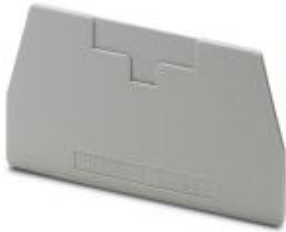
End cover, Length: 72 mm, Width: 2.2 mm, Height: 41.5 mm, Color: gray

Please be informed that the data shown in this PDF Document is generated from our Online Catalog. Please find the complete data in the user's documentation. Our General Terms of Use for Downloads are valid ( http://download.phoenixcontact.com )