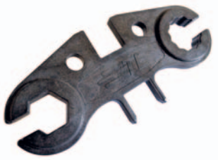
Field Tool - multiple functions, PN 1971903-1