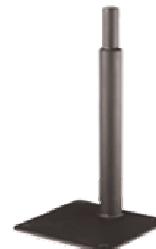
Model: 960-09 Mount Stand, 9" (203.2mm)

Click on any of the above images to find out more about the products pictured.