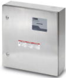
Indoor/outdoor lightning arrester and TVSS system for 120/208-240 V

Please be informed that the data shown in this PDF Document is generated from our Online Catalog. Please find the complete data in the user's documentation. Our General Terms of Use for Downloads are valid ( http://phoenixcontact.com/download )