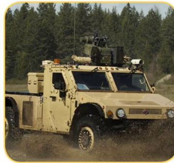
Unmanned Vehicle Control

The VG440 combines highly-reliable MEMS gyros and accelerometers with high-speed DSP electronics to provide a fully stabilized vertical gyroscope in a small and rugged environmentally-sealed enclosure. The VG440 provides consistent performance in challenging operating environments and is user-configurable for a wide variety of applications