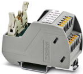
VARIOFACE Professional (VIP) board for the ROC800 controller

Please be informed that the data shown in this PDF Document is generated from our Online Catalog. Please find the complete data in the user's documentation. Our General Terms of Use for Downloads are valid ( http://phoenixcontact.com/download )