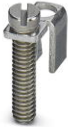
Chain bridge, Number of positions: 1, Color: silver

Please be informed that the data shown in this PDF Document is generated from our Online Catalog. Please find the complete data in the user's documentation. Our General Terms of Use for Downloads are valid ( http://download.phoenixcontact.com )