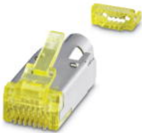
Male insert RJ45, CAT6 A , 10 Gigabit

Please be informed that the data shown in this PDF Document is generated from our Online Catalog. Please find the complete data in the user's documentation. Our General Terms of Use for Downloads are valid ( http://download.phoenixcontact.com )