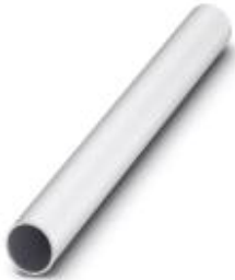
Tube, 400 mm long, Ø 25 mm

Please be informed that the data shown in this PDF Document is generated from our Online Catalog. Please find the complete data in the user's documentation. Our General Terms of Use for Downloads are valid ( http://phoenixcontact.com/download )