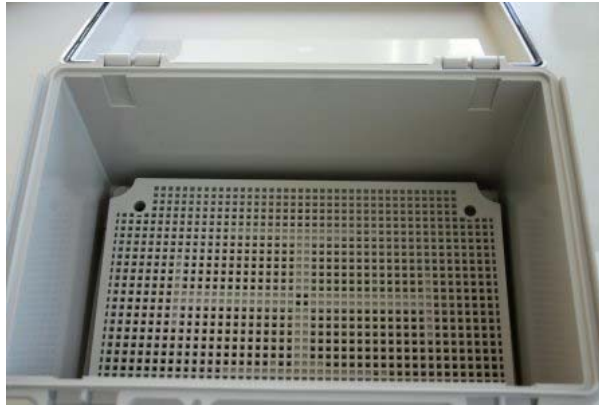
Click on Image for Larger View

An all plastic accessory panel used with the NBF series NEMA boxes that allows easy mounting of electronic devices in the box