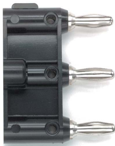
Model 2970 Triple Banana Plug