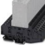
Modular socket element, 2-position, for holding two circuit breakers, each with a single position

Box mounting base - TMCP SOCKET M - 0916589