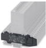
End cover, Length: 115 mm, Width: 6 mm, Color: black