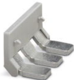
Insertion bridge, Number of positions: 3, Color: gray

Please be informed that the data shown in this PDF Document is generated from our Online Catalog. Please find the complete data in the user's documentation. Our General Terms of Use for Downloads are valid ( http://download.phoenixcontact.com )