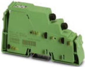
INTERBUS FO branch terminal block, without accessories, with remote bus branch, 24 V DC

Please be informed that the data shown in this PDF Document is generated from our Online Catalog. Please find the complete data in the user's documentation. Our General Terms of Use for Downloads are valid ( http://phoenixcontact.com/download )