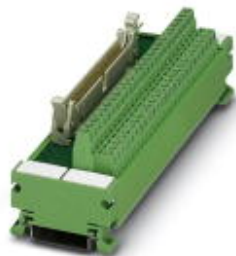
VARIOFACE module, with screw connection and flat-ribbon cable connector, for assembly on NS 35/7.5, 20 positions

Please be informed that the data shown in this PDF Document is generated from our Online Catalog. Please find the complete data in the user's documentation. Our General Terms of Use for Downloads are valid ( http://phoenixcontact.com/download )