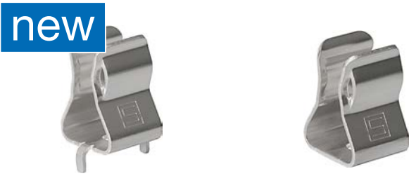
Solder THT version

Heavy Duty Fuse Clip, 10.3 x 38 / 10.3 x 85 mm, 1500 VAC/VDC, 32 A