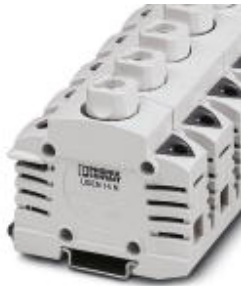
Fuse terminal blocks for NEOZED fuse inserts

Please be informed that the data shown in this PDF Document is generated from our Online Catalog. Please find the complete data in the user's documentation. Our General Terms of Use for Downloads are valid ( http://download.phoenixcontact.com )