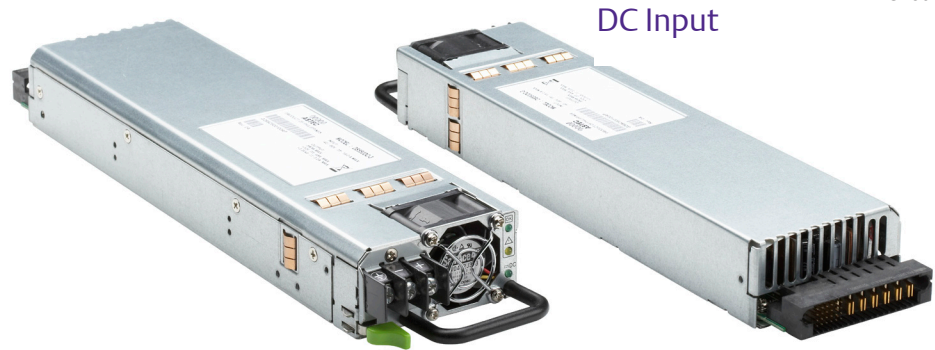
Connector input shown

Distributed Power Bulk Front-End Total Output Power: 450 - 550 Watts +12 Vdc main Output +3.3 Vdc Stand-by Output DC Input 36 - 75 Vdc