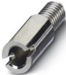
Female test connector, Color: silver

Please be informed that the data shown in this PDF Document is generated from our Online Catalog. Please find the complete data in the user's documentation. Our General Terms of Use for Downloads are valid ( http://download.phoenixcontact.com )