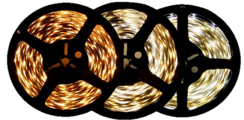
Warm White 3000K Pure White 4200K Cool White 6000K

Inspired LED Flexible Strip Lights are a simple, customizable solution for all of your LED lighting needs. These unique strips can be cut to length and terminated with solderless end connectors for easy DIY installation. Energy efficient, with a wide range of options for brightness and color, LED Flex Strips are the perfect option for any lighting application.