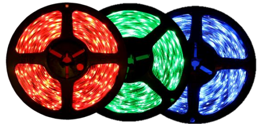
Red Green Blue Available in NB & SB Only NB, SB & UB Only