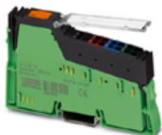
Inline coupling module, complete with accessories (connector and marking label)

Please be informed that the data shown in this PDF Document is generated from our Online Catalog. Please find the complete data in the user's documentation. Our General Terms of Use for Downloads are valid ( http://phoenixcontact.com/download )