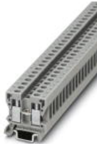
Feed-through terminal block, Connection method: Screw connection, Cross section: 0.2 mm 2 - 2.5 mm 2 , AWG 24 - 14, Width: 5.2 mm, Color: gray, Mounting type: NS 15

Please be informed that the data shown in this PDF Document is generated from our Online Catalog. Please find the complete data in the user's documentation. Our General Terms of Use for Downloads are valid ( http://download.phoenixcontact.com )