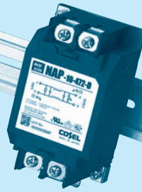
DIN rail installation type is option