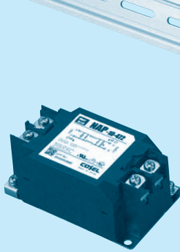
The terminal cover is retracted inside the unit