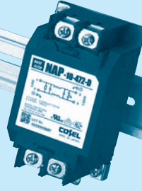
DIN rail installation type is option